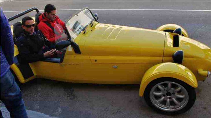
Super 7. Weistfield.